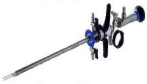
開腹せずに手術が可能です

また、外来の子宮鏡検査によつて何らかの異常が認められた場合には、子宮鏡を用いて切除や癒着剥離などの手術を行うことが可能です。先端についている電気メスで、ポリープや筋腫を切除する手術になります。その様子は子宮鏡に内蔵されたカメラからモニターに