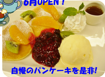
自慢のパンケーキを是非!

フラワーズを是非ご利用下さい。当院のレストランは、入院の患者様からも大変ご好評を頂いています。そのお食事を担当するシエフによる自家製のパンケーキをご用意しております。お待ちしています。お飲み物も各種揃えておりますので、