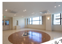
会場は6階ホールです