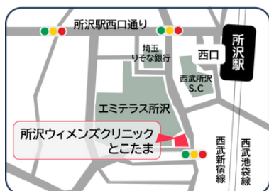
所沢市東住吉10-11コネクト所沢2階

瀬戸病院で行っていた不妊治療をより専門的に行うために、「所沢ウィメンズクリニックとこたま」を新規開院いたしました。所沢駅西口から歩行者デッキ直結徒歩3分、エミテラス所沢からもデッキにて直結しています。